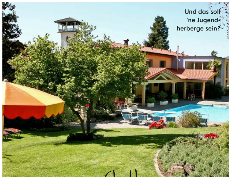
Und das soll 'ne Jugendherberge sein?