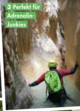
3 Perfekt für Adrenalin-Junkies