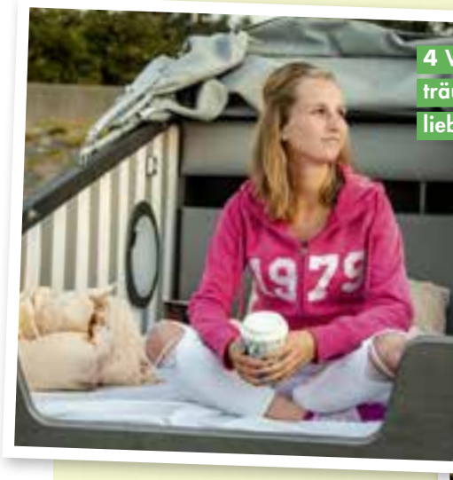
4 Vom Strand träumen? Nee, lieber am Strand!