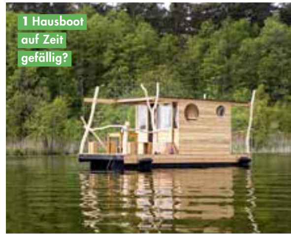
1 Hausboot auf Zeit gefällig?