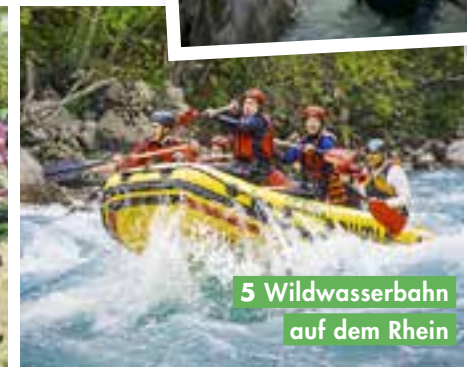
5 Wildwasserbahn auf dem Rhein