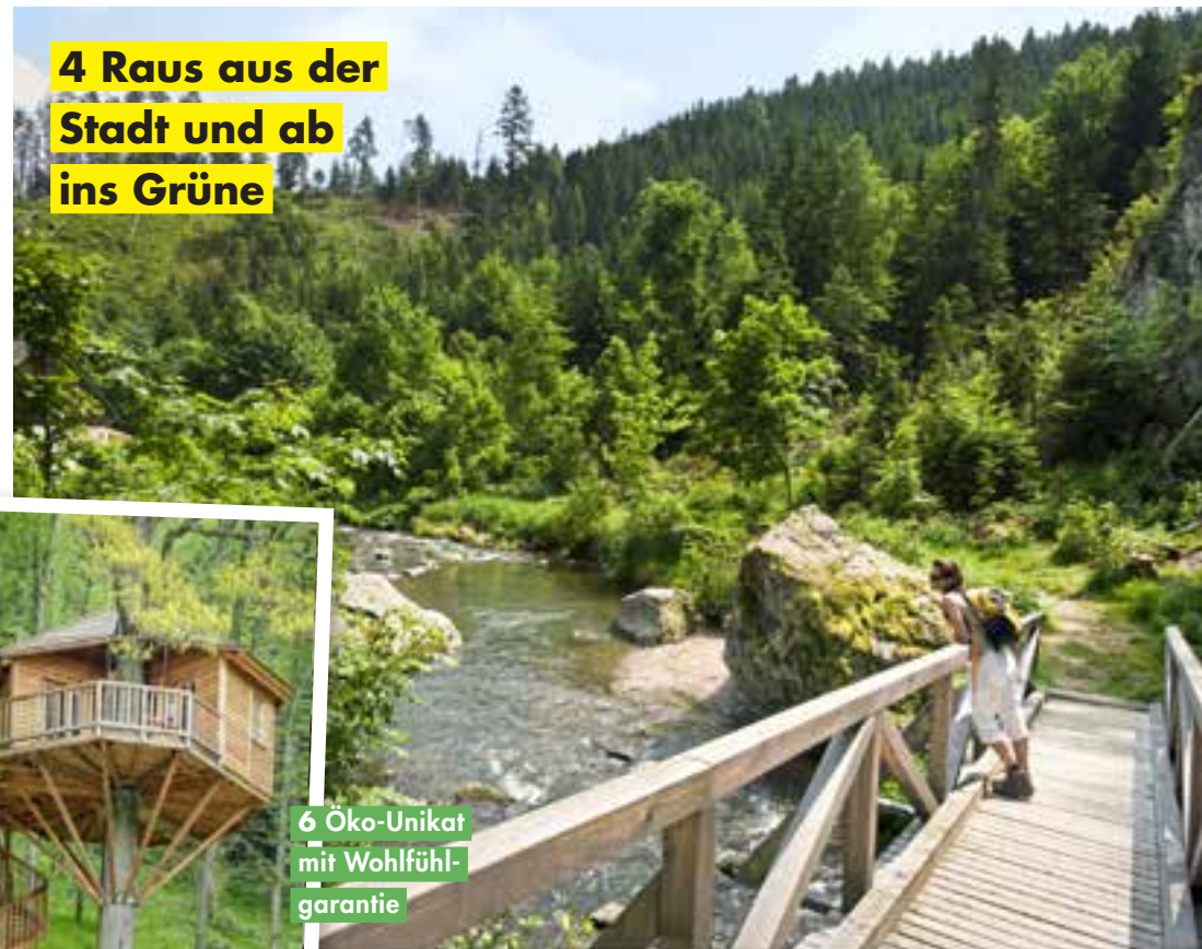
4 Raus aus der Stadt und ab ins Grüne