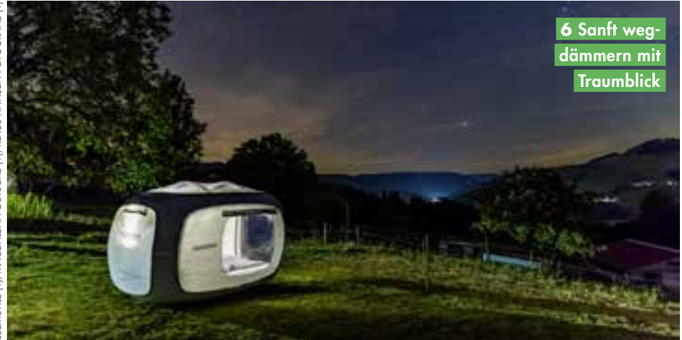
6 Sanft weg-dämmern mit Traumblick