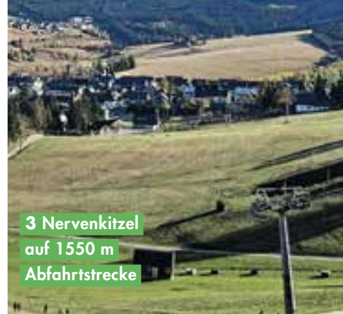
3 Nervenkitzel auf 1550 m Abfahrtstrecke