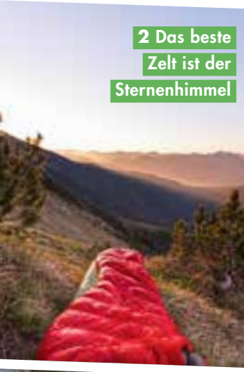
2 Das beste Zelt ist der Sternenhimmel